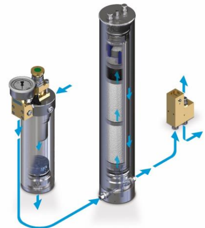
Filtersystem P41 (Abbildung ähnlich)