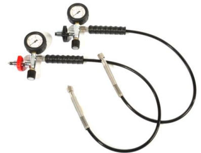
Füllrichtung PN200 bzw. PN300