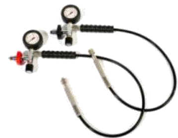
Fülleinrichtung PN200 bzw. PN300

Hochwertige Hochdruckfüllschläuche aus lebensmittelechtem und langlebigem Schlauchmaterial sorgen für eine flexible und sichere Handhabung. Schwenkbare Schlauchanschlüsse ermöglichen den schnellen, einfachen und sicheren Anschluss des Füllventils an die Atemluftflasche.