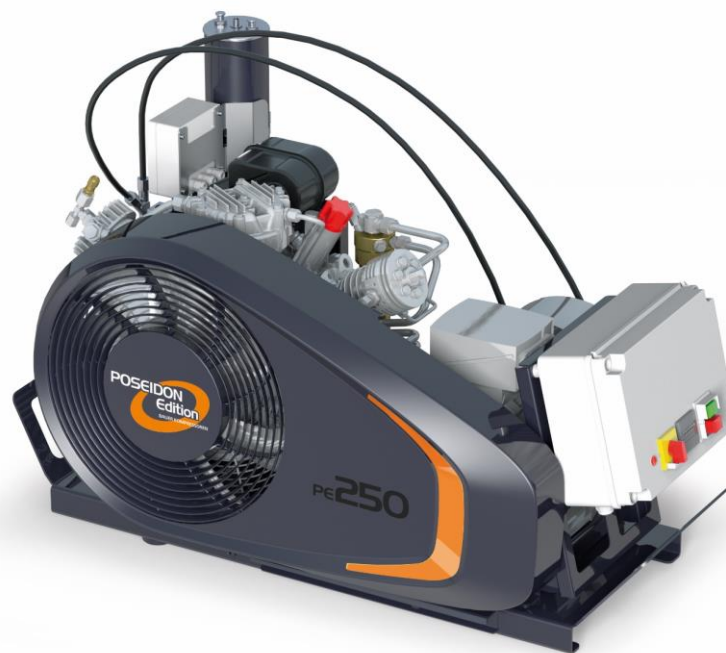
PE250-TE mit Kompressorsteuerung (Sonderausstattung)